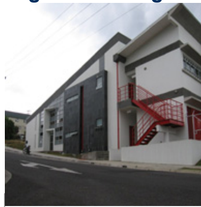
El CELEQ forma parte de los organizadores.

Del 14 al 18 de marzo, en el hotel Double Tree by Hilton - Cariari, se realizará el “XXII Congreso de la Sociedad Iberoamericana de Electroquímica SIBAE2016”.